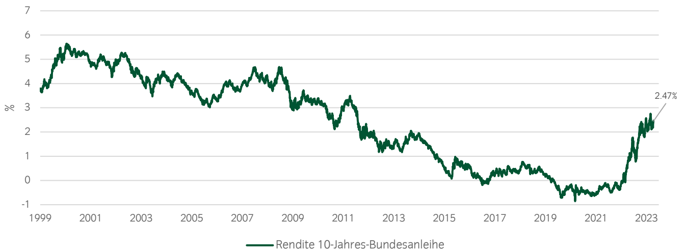
Abbildung 2: Rendite 10-Jahres-Bundesanleihe seit 1999 2