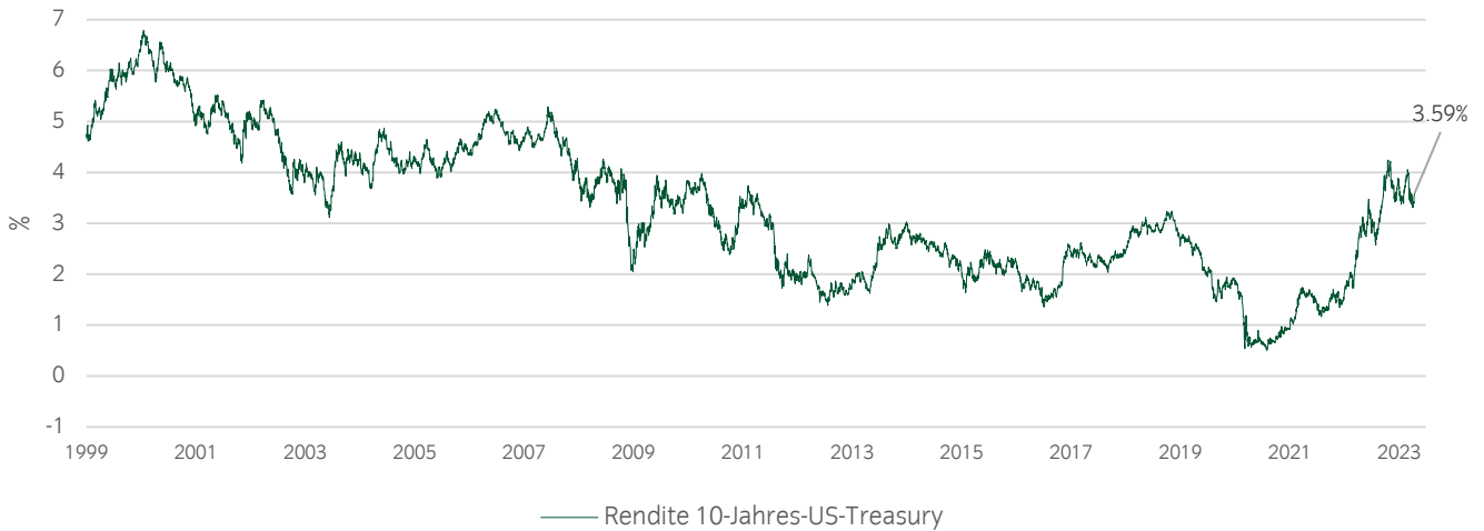
Abbildung 5: Rendite 10-Jahres-US-Treasury seit 1999 5